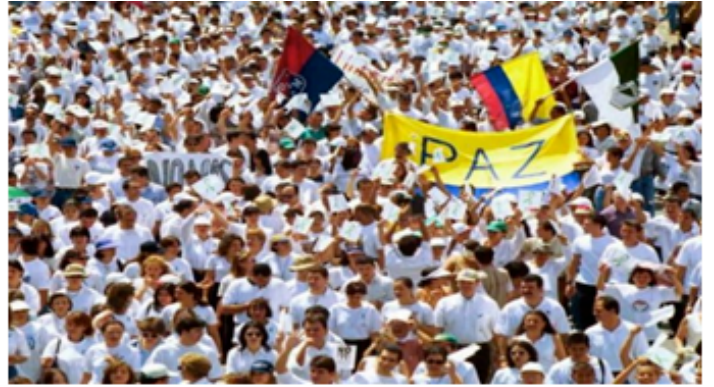
Marcha por la paz, Colombia.

a. ¿Qué características de la democracia se observan en estas imágenes?