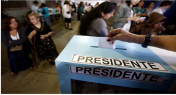
Personas asistiendo a una jornada de votación.

3. Observa las siguientes imágenes y luego responde las preguntas EN TU CUADERNO: